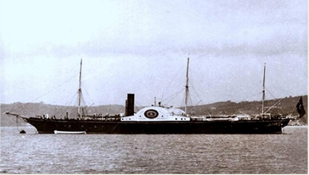
Şekil 2. Sultan Abdülaziz'in Avrupa'ya Seyahati İçin Kullandığı Sultaniye Vapuru. Kaynak: (Ertemli, 2023, s. 53)

Emir subayı olarak beş binbaşı, bir teğmen ve altı silahşör (Karaer, 2003, s. 60).