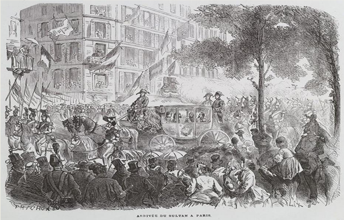
Şekil 3. Sultan Abdülaziz'in Paris'e Varmasının Tasvir Edildiği Resim.

Bütün sokaklara, evlere bayraklar ve her türden simgeler asılmıştı. Bu durum alışılmamış bir görüntü sergiliyordu. Rıhtıma pek uzak olmayan bir yerde yeşil bir bayrak görülmüyordu. Ortasından kocaman bir ayyıldız ile ikiye ayrılan bu bayrağın yanında Meryem Ana, diğer yanında ise elinde kılıcı ile Saint Louis temsil ediliyordu. Bu amblemlerle süslenen ev, adeta iki dinin uzlaşmasını simgeliyordu (Yurtbilir, 2014, s. 140).