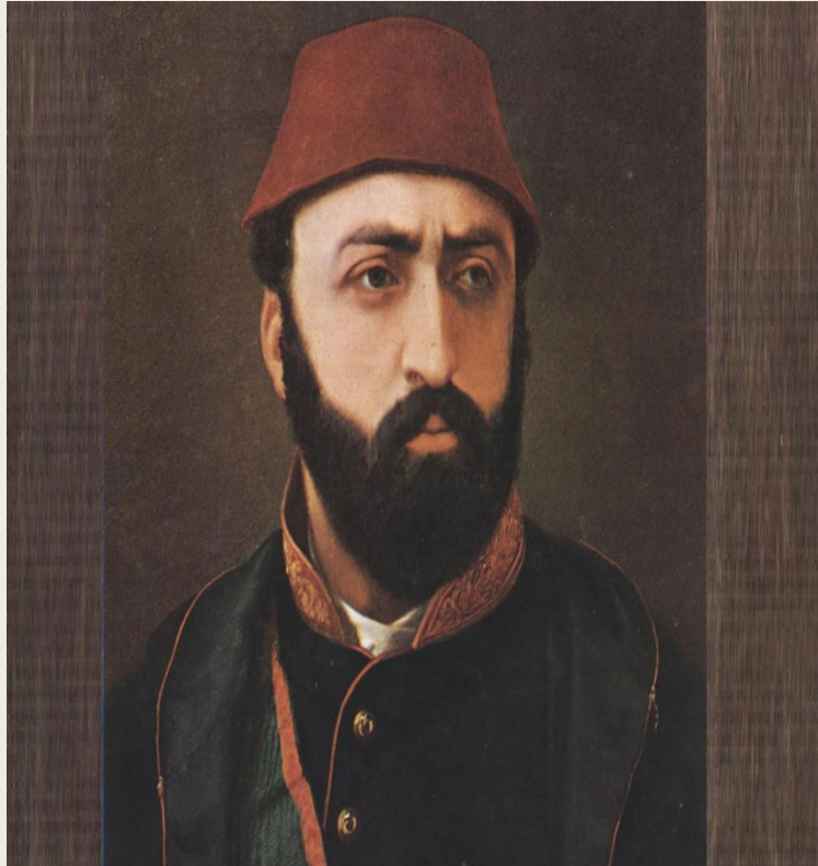
Şekil 1. Sultan Abdülaziz'in Portresi.